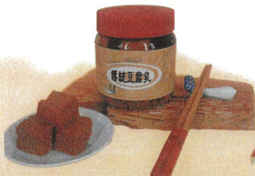
非基改豆腐乳 售價 200 元/罐 600 公克