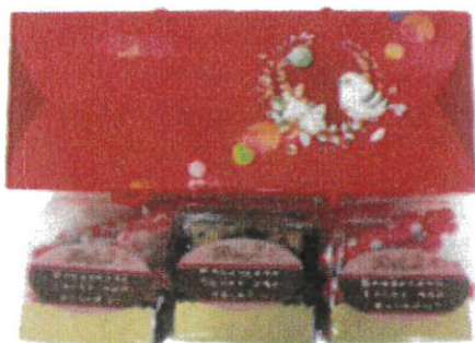
如意禮盒 售價 310 元/盒 438 公克