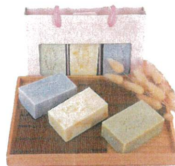
手工冷皂 售價 85 元/塊 270 元/盒 3 入