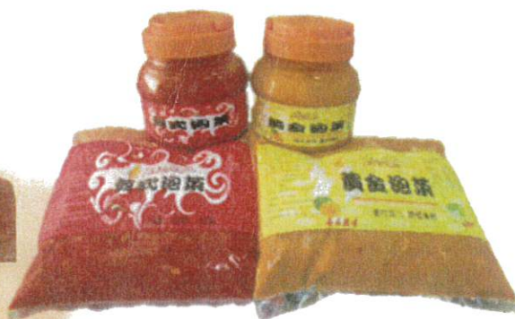
韓式泡菜/黃金泡菜 售價 140 元/罐 650 公克 180 元/袋 1000 公克