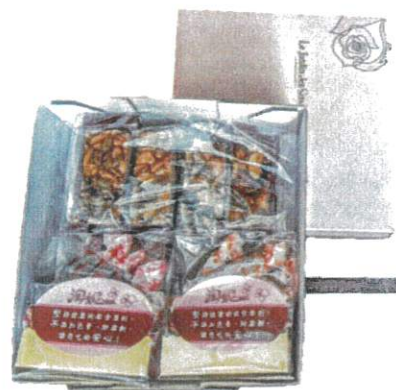
富貴禮盒 售價 380 元/盒 460 公克