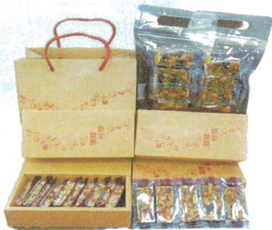
養生堅果 售價 220 元/盒 230 公克 220 元/袋 230 公克