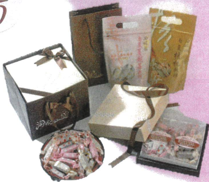
南棗核桃軟糖 售價 180 元/包 300 公克 南棗蔓越莓軟糖 410 元/盒 600 公克